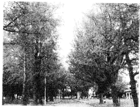
〈歴史館イチョウ並木〉